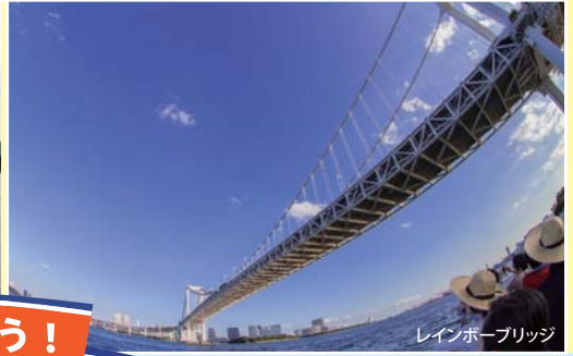
レインボーブリッジ