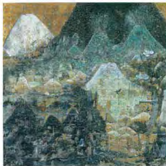
三瀬夏之介「日本の山」/ 2003