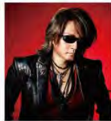
パーソナリティ: 石井竜也