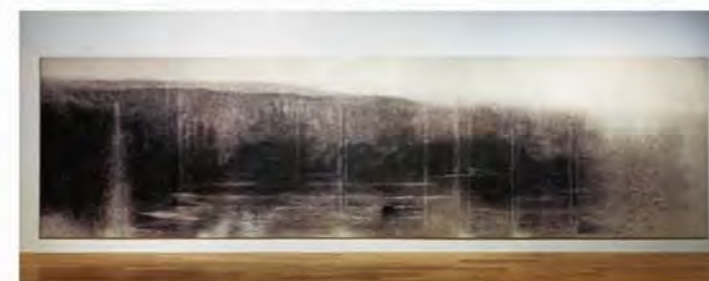
『Landscape of cliff(崖の風景)』 H2300×W8000mm Layered on tulle 布/染料/木製パネル

TERRADA ART AWARD 2014寺田賞受賞者、賀門利誓の個展。賀門は京都精華大学芸術学部素材表現学科にて染色を専門に学び、親族に関わる古い写真を題材に、多岐にわたる日本の伝統的染色技法と最先端の染色科学を用いて染めた布のピース(片)を大量に堆積、画面にイメージを再構成しています。加工、再現された新たな像の中にある希薄性イメージにより、写真と絵画の真実性と現実性を問う作品を堪能ください。