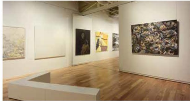
TERRADA ART AWARD 2014展示会場の様子

このたび、寺田倉庫が運営するT-Art Galleryにて、第二回目となる『TERRADA ART AWARD 2015 入選者展』を開催いたします。今回の募集には、18歳から39歳の若手アーティスト1,205名、絵画・写真・版画などの平面作品2,205点の応募がございました。この中から厳正な1次審査、最終審査にて選ばれた入選者20名の展覧会を、ギャラリースペースであるT-Art Galleryにて『TERRADA ART AWARD 2015 入選者展』として開催致します。平面表現の可能性を感じていただける力強い作品が集まっています。ぜひご覧いただければ幸いです。