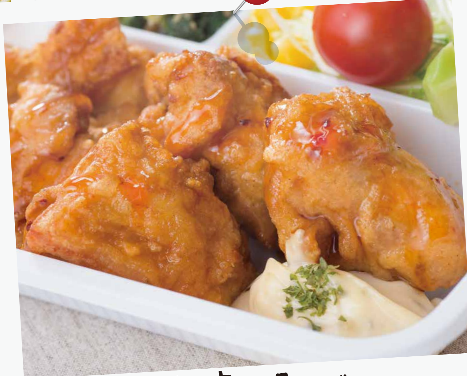
鶏唐揚げ 黒酢タルタル