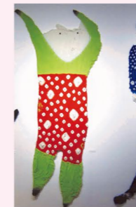
菅野健一・染 KENICHI Sugano

開催時間 8:30~20:00 (最終日 16:00まで / 土日祝休館) 入場無料 全く違うアートシーンで発表してきた4人が2011年より展示をはじめ今年で6回目。この大きな天王洲アートホール空間で発表するアートづくりは、この建築物との対話から始まり、展示方法でさえアートの一部と考え創作しています。4人の作品がホール空間に新たな装いと印象を、ホールへ訪れる人が感じられたらと願っています。