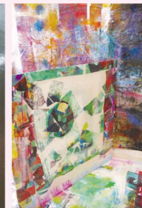
山梨且二・画 KATSUJI Yamanashi