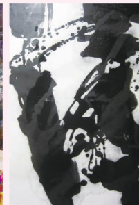
渡邊佐和子・書 SAWAKO Watanabe