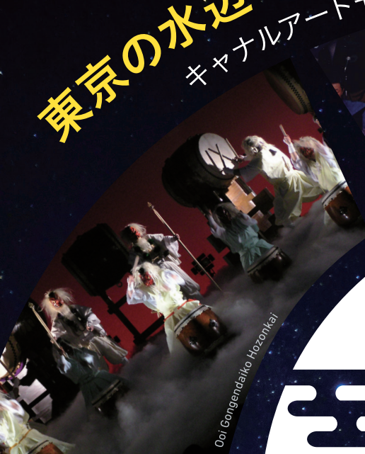
Ooi Gogendaiiko Hozonkai

東京の水辺で日本の芸術文化を楽しむプレミアムライブ キャンナルアートモーメント品川2020 ~ Art Empowerment ~